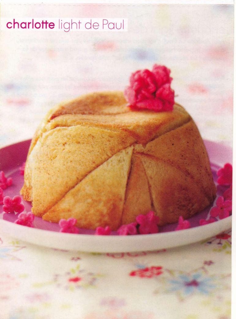
charlotte light de Paul